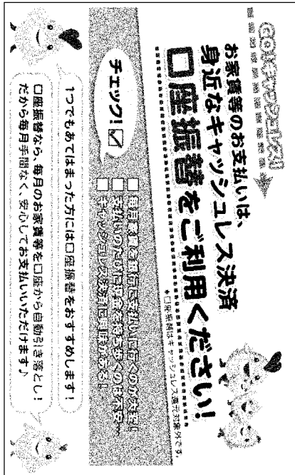
図E-4-1 住宅供給公社広報紙（ジョイイラ） 口座振替の記事

こうした方策の結果、口座振替利用率について直近3年間の実績は次のとおりであるが、口座振替を利用しない入居者も8%程度存在する。